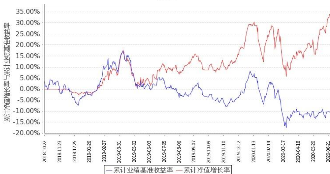
图 1：嘉实资源精选股票 A 基金份额累计净值增长率与同期业绩比较基准收益率的历史走势对比图