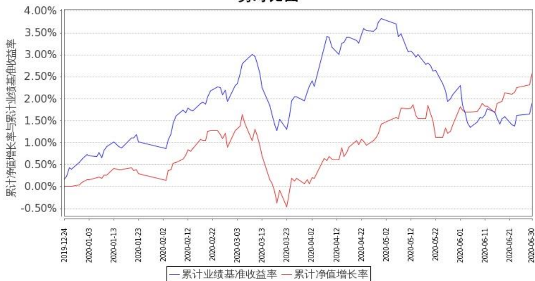
图 2: 嘉实鑫和一年持有期混合 C 基金份额累计净值增长率与同期业绩比较基准收益率的历史走势对比图