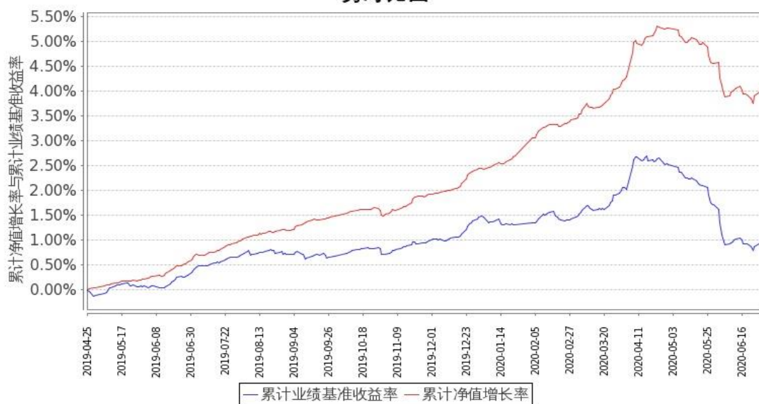
图 1：嘉实中债 1-3 政金债指数 A 基金份额累计净值增长率与同期业绩比较基准收益率的