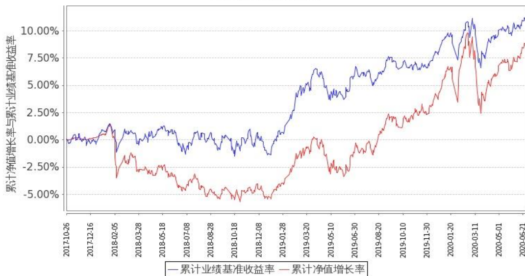
图 2：嘉实领航资产配置混合(FOF)C 基金份额累计净值增长率与同期业绩比较基准收益率的历史走势对比图