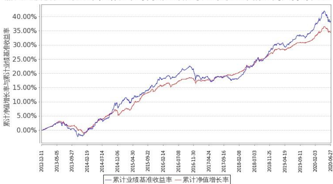
图 2: 嘉实纯债债券 C 基金份额累计净值增长率与同期业绩比较基准收益率的历史走势对比图