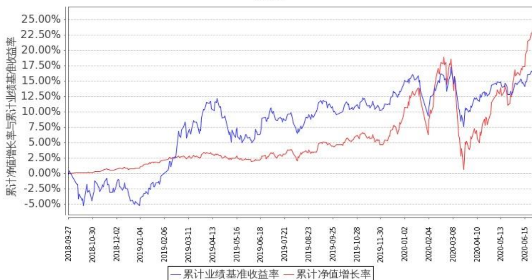
图 1：嘉实新添康定期混合 A 基金份额累计净值增长率与同期业绩比较基准收益率的历史走势对比图