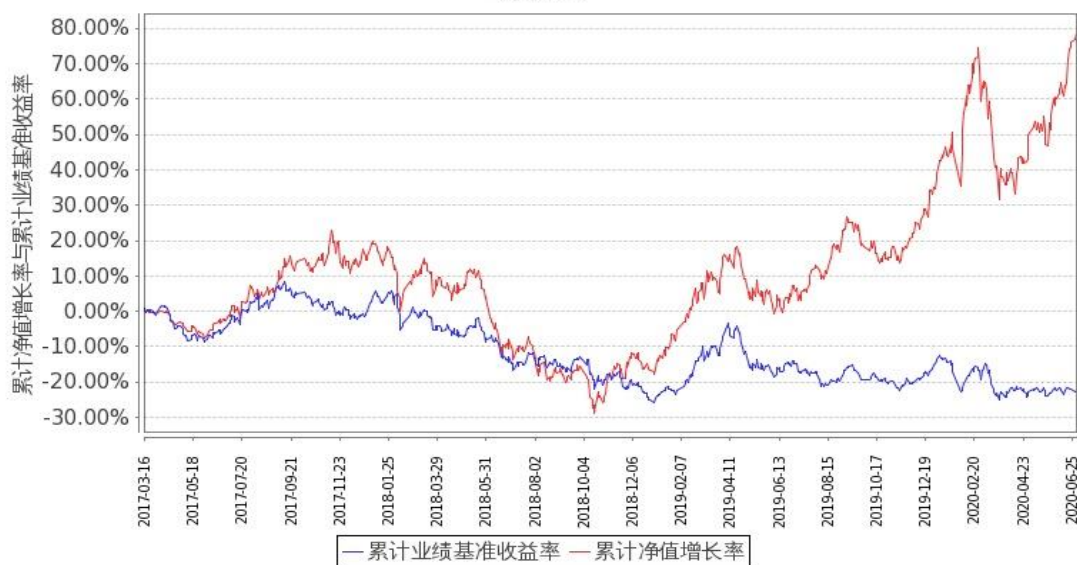
图 2：嘉实新能源新材料股票 C 基金份额累计净值增长率与同期业绩比较基准收益率的历史走势对比图