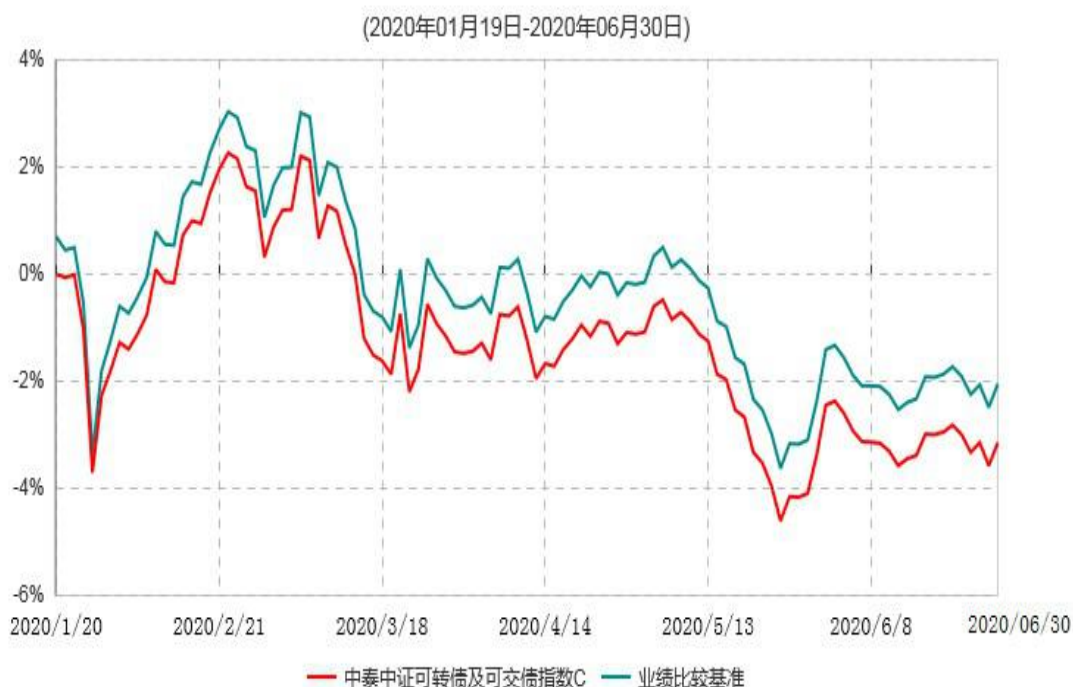
中泰中证可转债及可交换债券指数C累计净值增长率与业绩比较基准收益率历史走势对比图