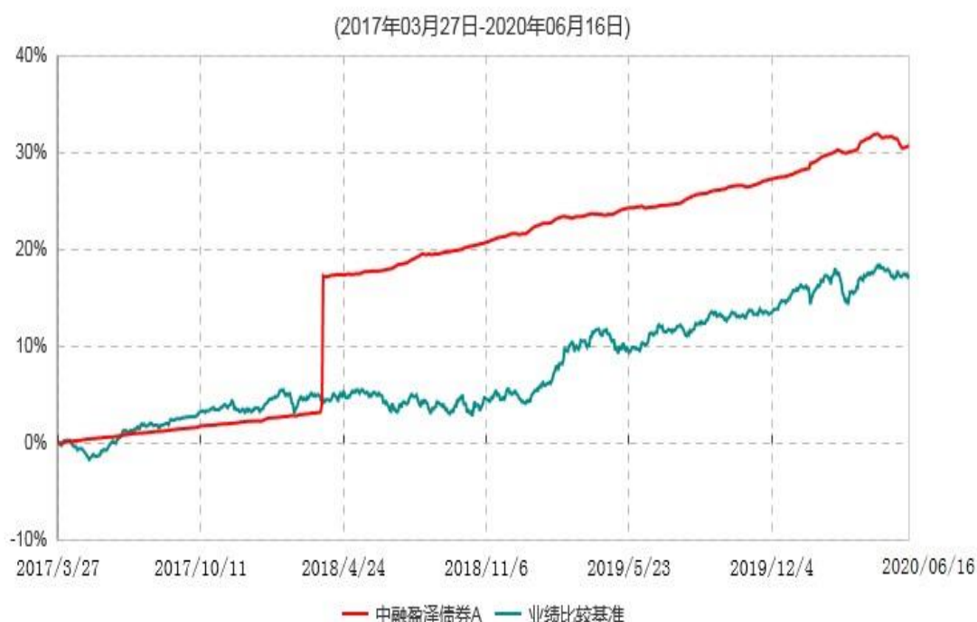
中融盈泽债券A累计净值增长率与业绩比较基准收益率历史走势对比图