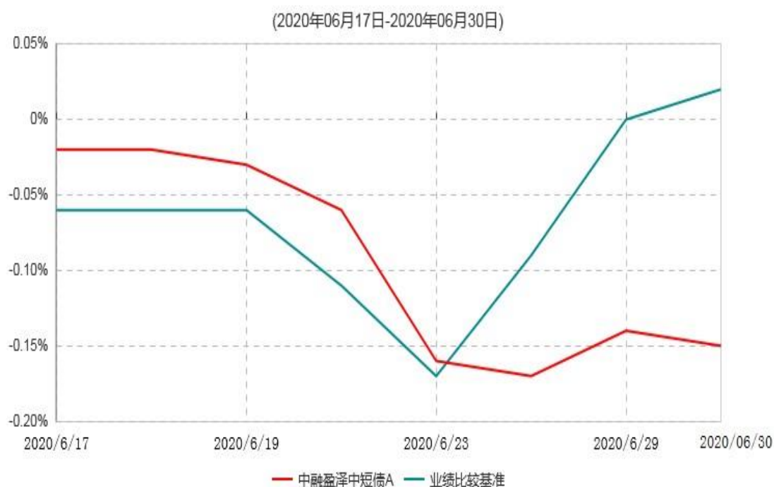
中融盈泽中短债A累计净值增长率与业绩比较基准收益率历史走势对比图