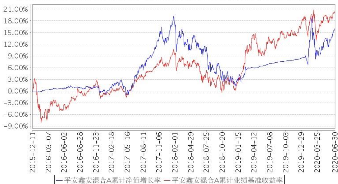
平安鑫安混合A累计净值增长率与同期业绩比较基准收益率的历史走势对比图