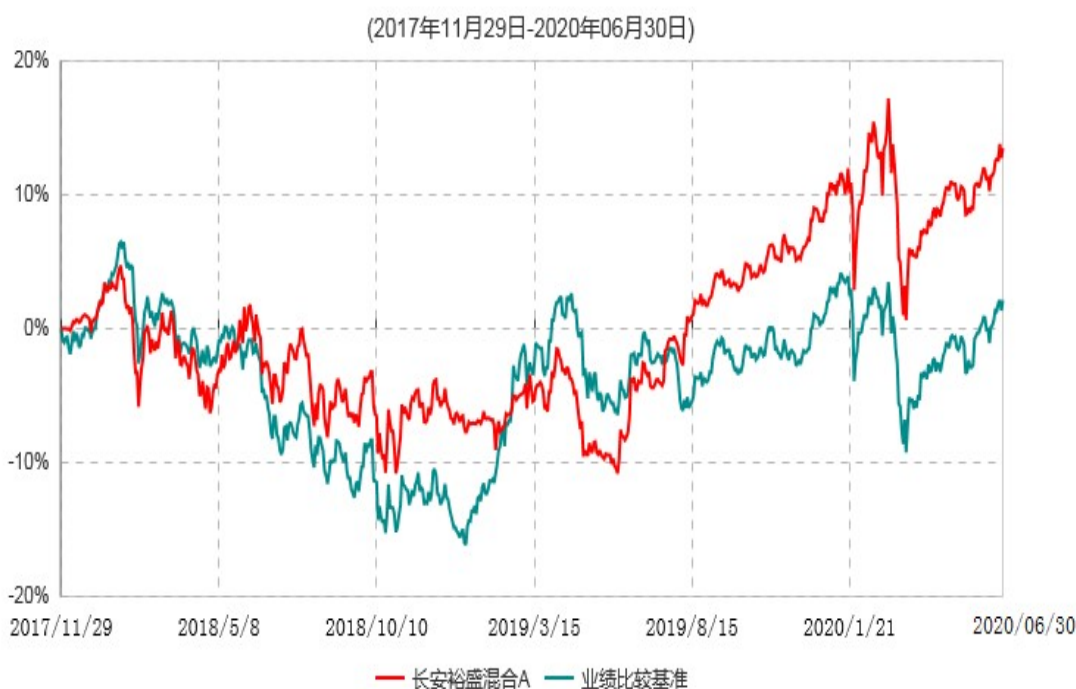
长安裕盛混合A累计净值增长率与业绩比较基准收益率历史走势对比图

根据基金合同的规定,自基金合同生效之日起6个月内基金各项资产配置比例需符合基金合同要求。本基金在建仓期结束后,各项资产配置比例已符合基金合同有关投资比例的约定。基金合同生效日至报告期期末,本基金运作时间超过一年。图示日期为2017年11月29日至2020年06月30日。