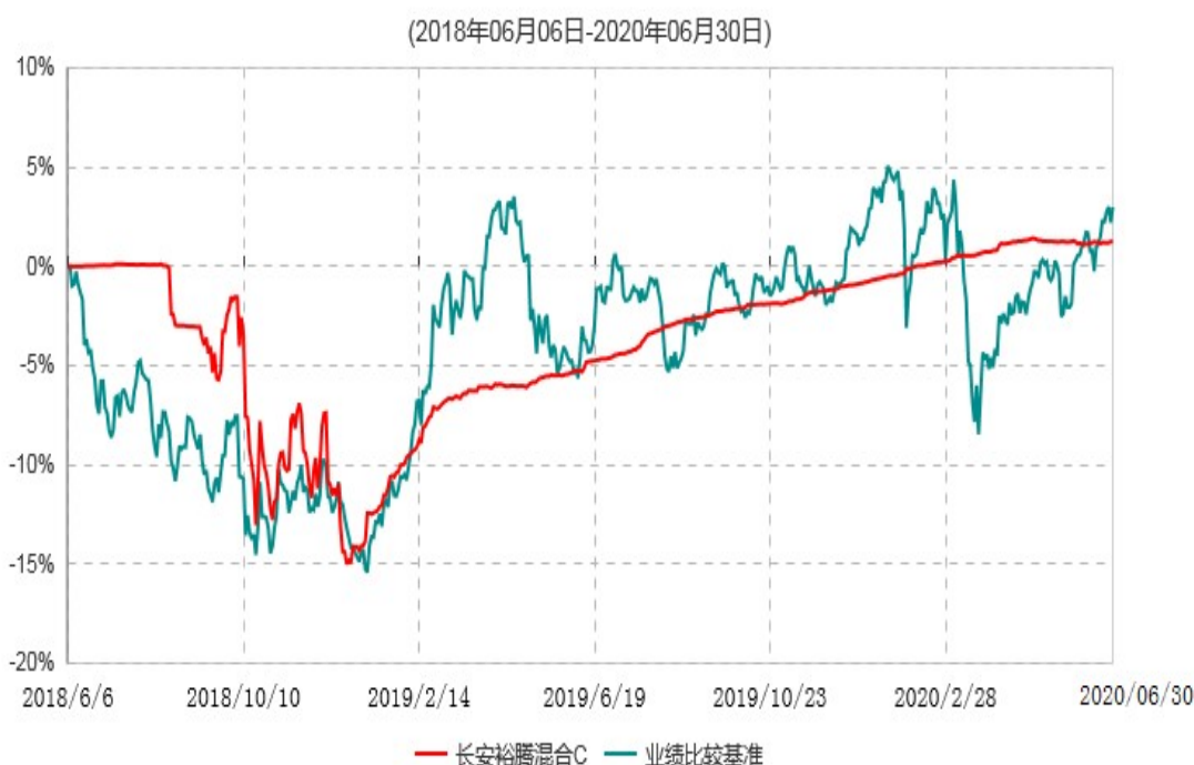
长安裕腾混合C累计净值增长率与业绩比较基准收益率历史走势对比图

根据基金合同的规定,自基金合同生效之日起6个月内基金各项资产配置比例需符合基金合同要求。本基金在建仓期结束后,各项资产配置比例已符合基金合同有关投资比例的约定。基金合同生效日至报告期末,本基金运作时间已满一年。图示日期为2018年06月06日至2020年6月30日。