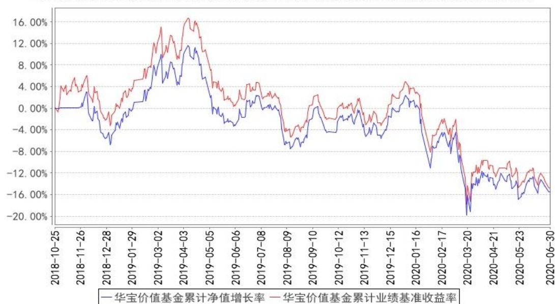
华宝价值基金累计净值增长率与同期业绩比较基准收益率的历史走势对比图