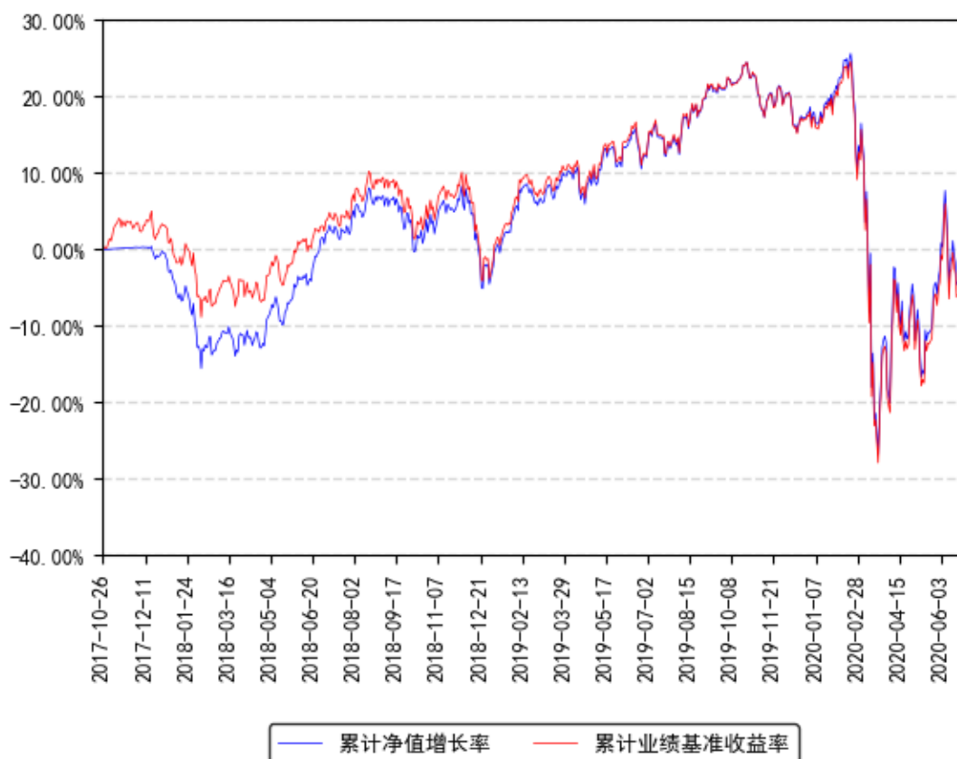
美国REIT累计净值增长率与同期业绩比较基准收益率的历史走势对比图