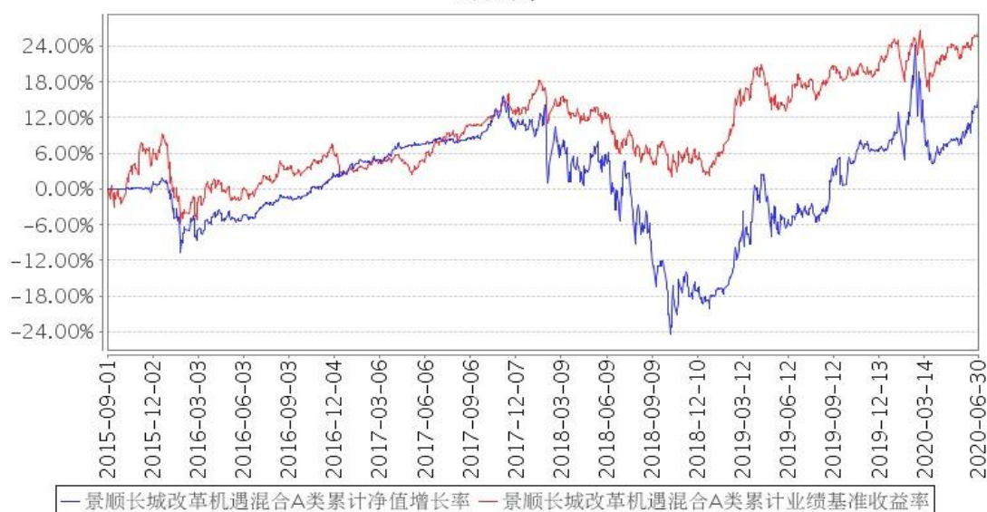
景顺长城改革机遇混合A类累计净值增长率与同期业绩比较基准收益率的历史走势对比图