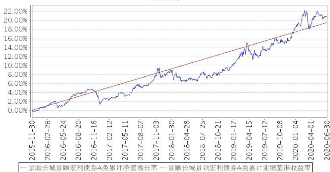
景顺长城景颐宏利债券A类累计净值增长率与同期业绩比较基准收益率的历史走势对比图