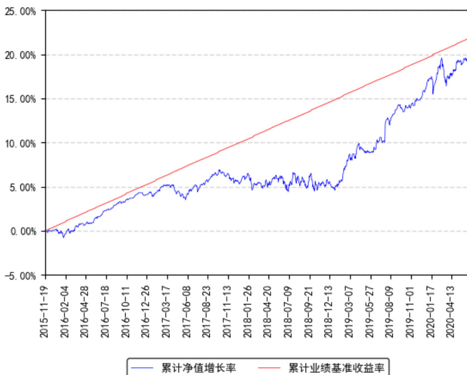
南方利安灵活配置混合A累计净值增长率与同期业绩比较基准收益率的历史走势对比图