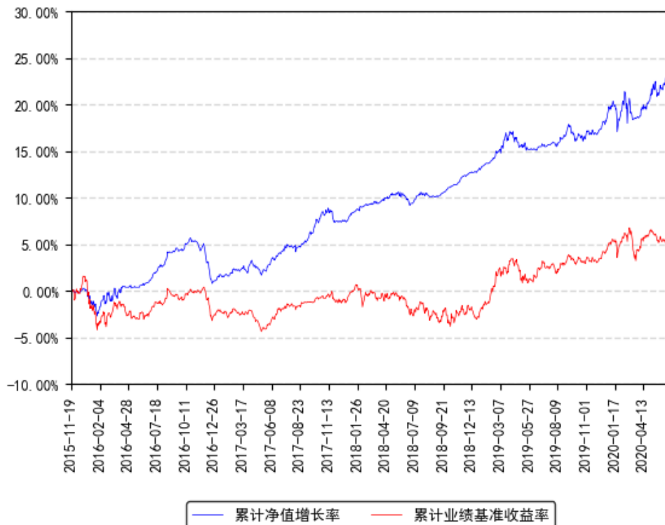
南方荣光灵活配置混合A累计净值增长率与同期业绩比较基准收益率的历史走势对比图