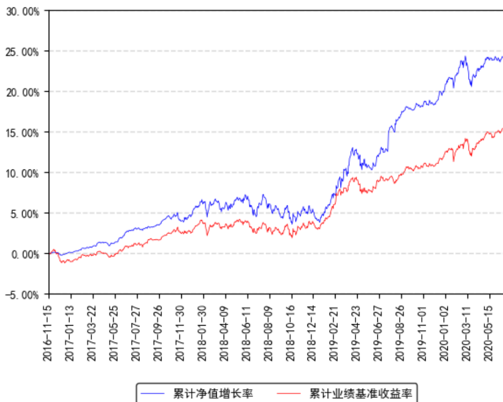
南方安裕混合A累计净值增长率与同期业绩比较基准收益率的历史走势对比图