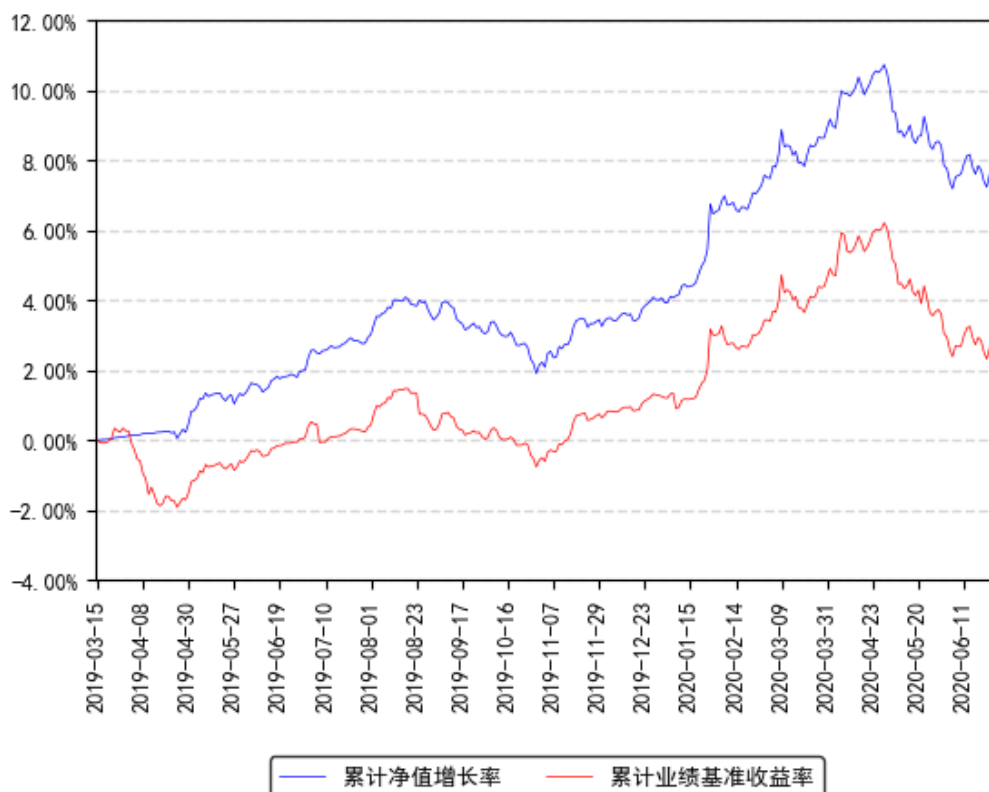
南方7-10年国开债A累计净值增长率与同期业绩比较基准收益率的历史走势对比图