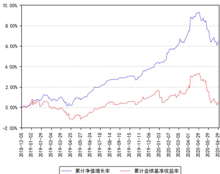
南方中债3-5年农发行债券指数A累计净值增长率与同期业绩比较基准收益率的历史走势对比图