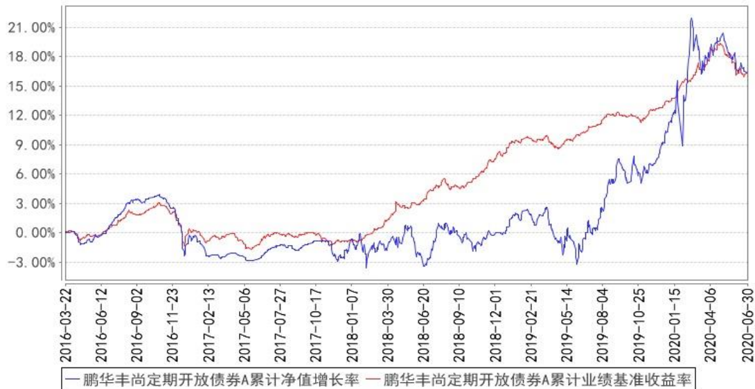
鹏华丰尚定期开放债券A累计净值增长率与同期业绩比较基准收益率的历史走势对比图