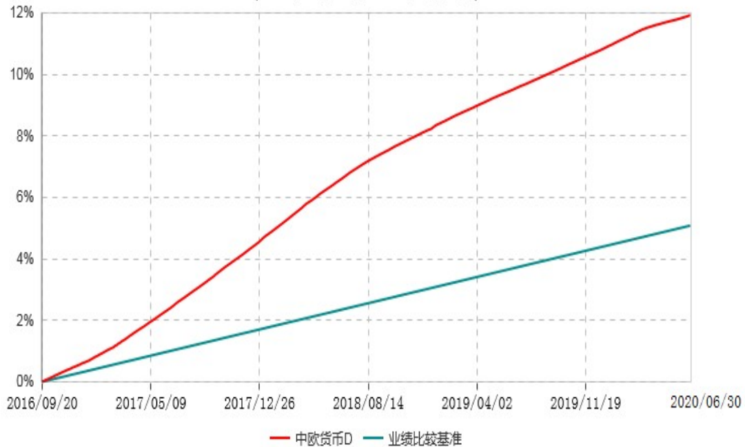
中欧货币D累计净值收益率与业绩比较基准收益率历史走势对比图 (2016年09月20日-2020年06月30日)

注本基金于2016年5月4日新增D类份额。图示日期为2016年9月20日至2020年6月30日。