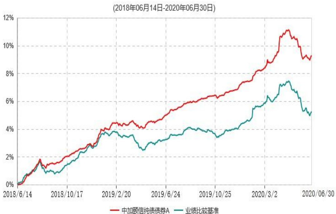
中加颐信纯债债券A累计净值增长率与业绩比较基准收益率历史走势对比图