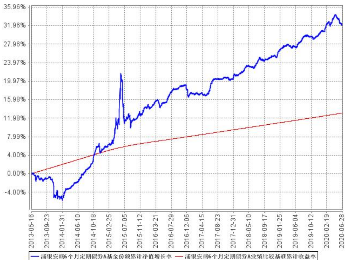
浦银安盛6个月定期债券A基金份额累计净值增长率与同期业绩比较基准收益率的历史走势对比图