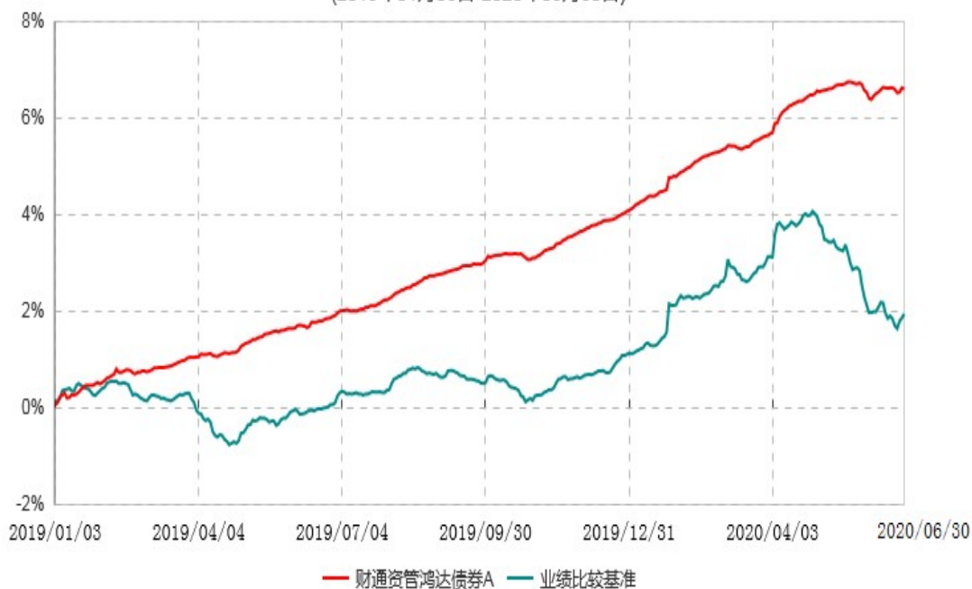
财通资管鸿达债券C累计净值增长率与业绩比较基准收益率历史走势对比图