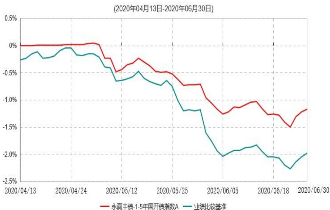
永赢中债-1-5年国开债指数A累计净值增长率与业绩比较基准收益率历史走势对比图

注：1、本基金合同生效日为 2020 年 04 月 13 日，截至本报告期末本基金合同生效未满足 1 年； 2、本基金建仓期为本基金合同生效日起 6 个月，截至本报告期末，本基金尚处于建仓期中。