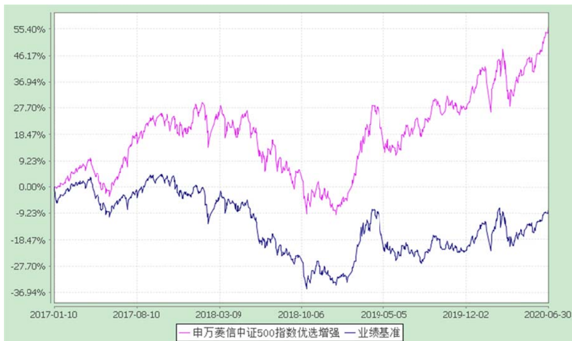
申万菱信中证 500 指数优选增强 C