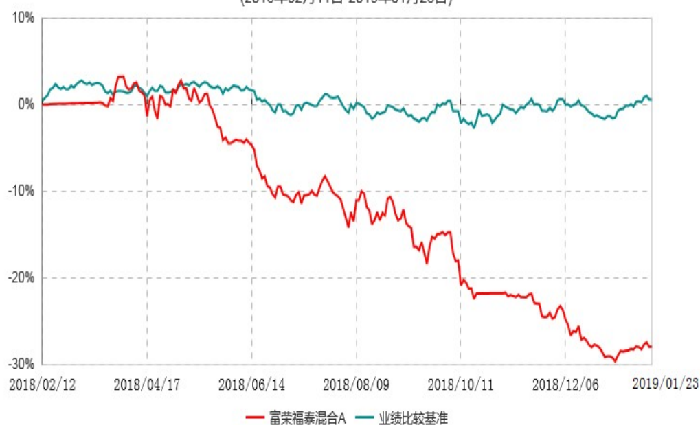
富荣福泰混合C累计净值增长率与业绩比较基准收益率历史走势对比图