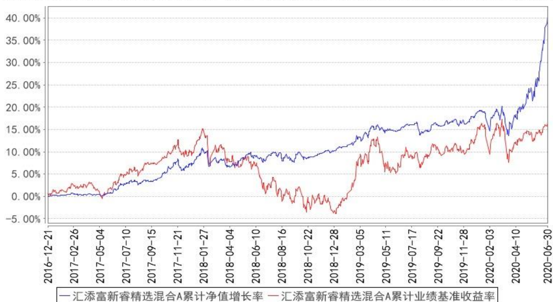
汇添富新睿精选混合A累计净值增长率与同期业绩比较基准收益率的历史走势对比图