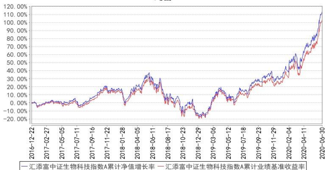
汇添富中证生物科技指数A累计净值增长率与同期业绩比较基准收益率的历史走势图