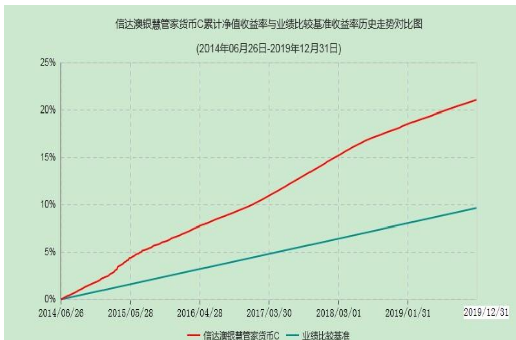
信达澳银慧管家货币 E