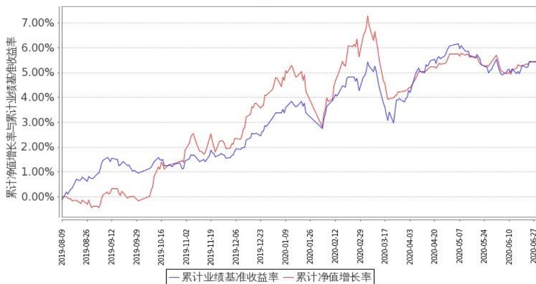
图 2：嘉实新添益定期混合 C 基金份额累计净值增长率与同期业绩比较基准收益率的历史走势对比图