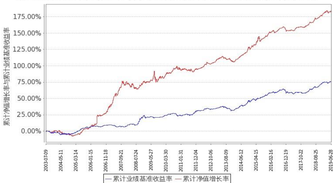
图：嘉实债券份额累计净值增长率与同期业绩比较基准收益率的历史走势对比图