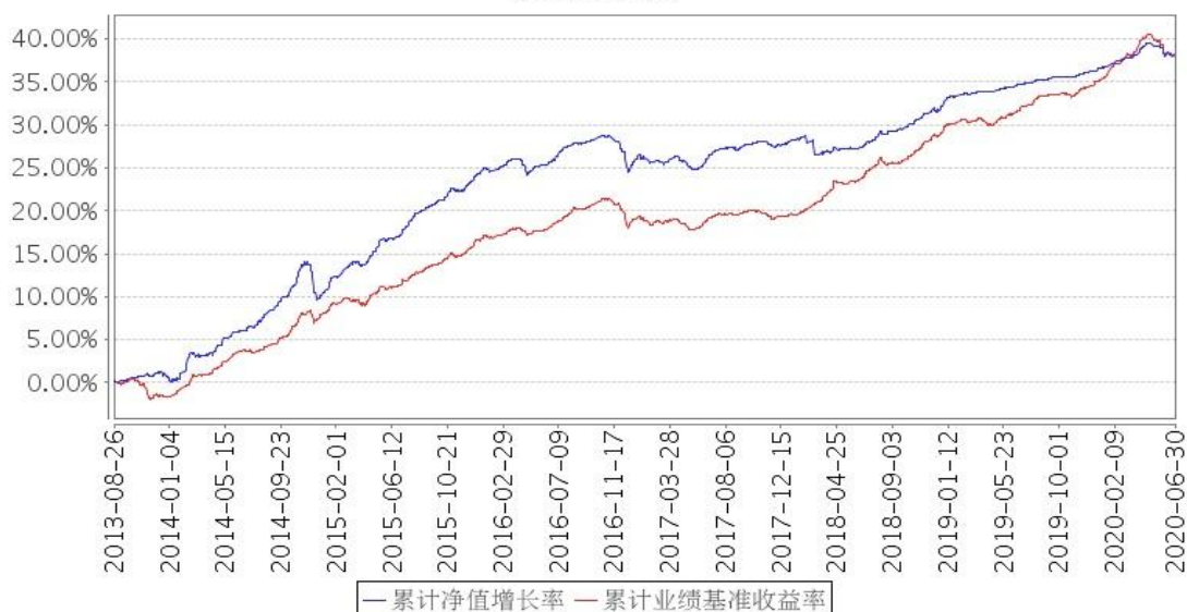
景顺长城景兴信用纯债债券A类累计净值增长率与同期业绩比较基准收益率的历史走势对比图