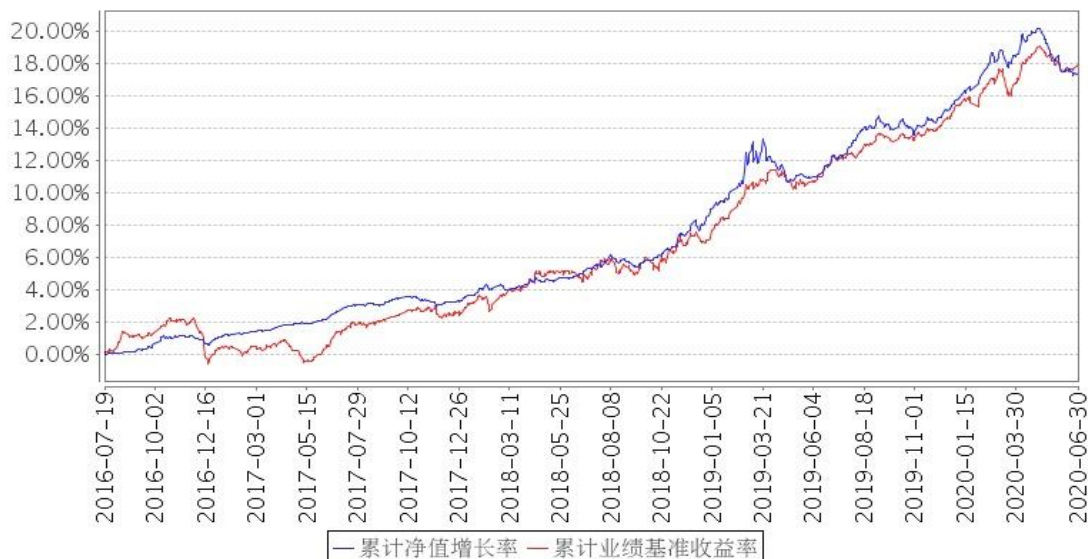
景顺长城景盈双利债券A类累计净值增长率与同期业绩比较基准收益率的历史走势对比图