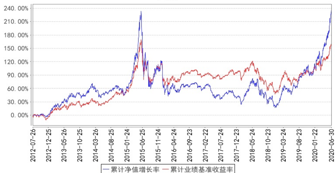
融通医疗保健行业混合A/B累计净值增长率与同期业绩比较基准收益率的历史走势对比图