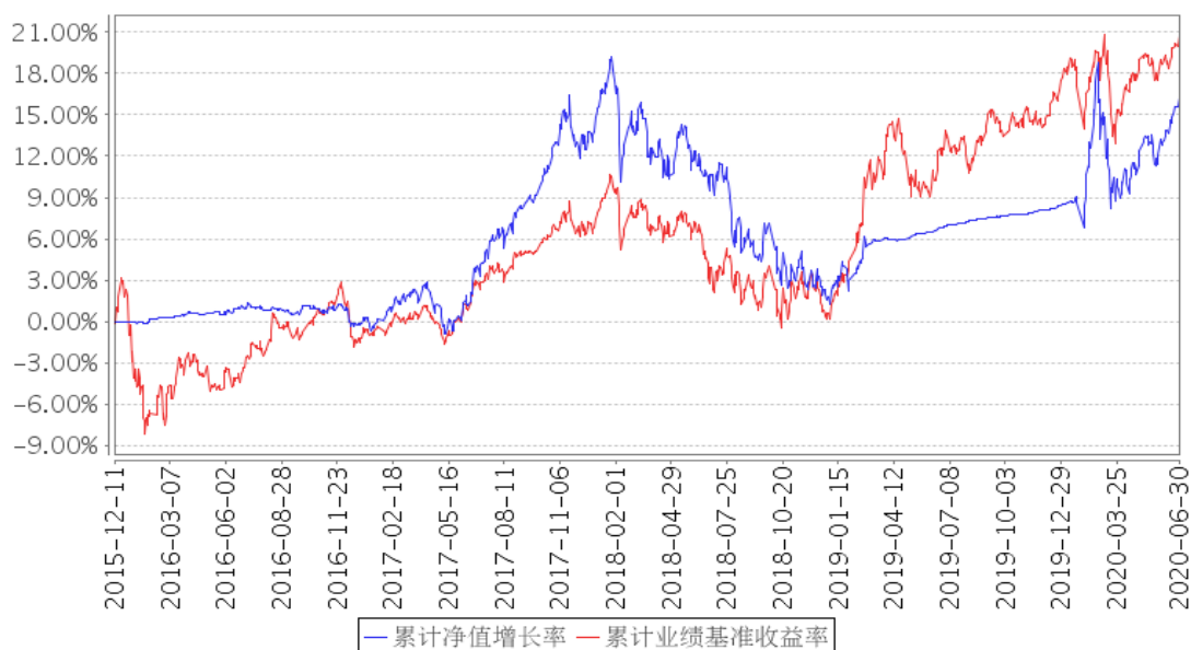
平安鑫安混合A累计净值增长率与同期业绩比较基准收益率的历史走势对比图