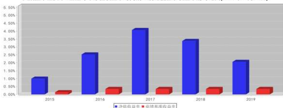
大成恒丰宝货币A基金每年净值收益率与同期业绩比较基准收益率的对比图(2019年12月31日)