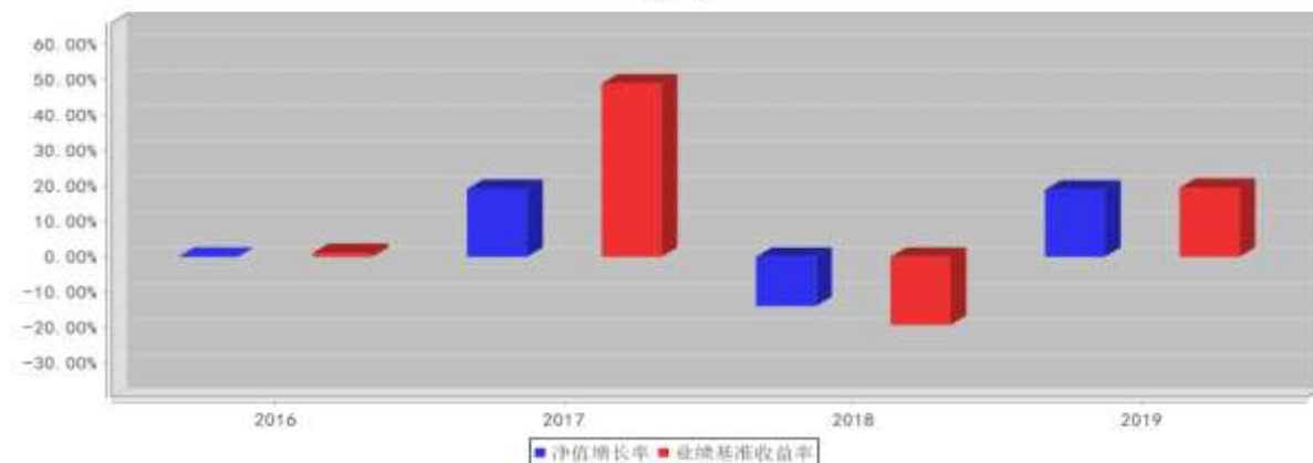
大成海外中国机会混合（QDII-LOF）基金每年净值增长率与同期业绩比较基准收益率的对比图(2019年12月31日)

注:1、基金的过往业绩不代表未来表现。 2、如合同生效当年不满完整自然年度的，按实际期限计算净值增长率。