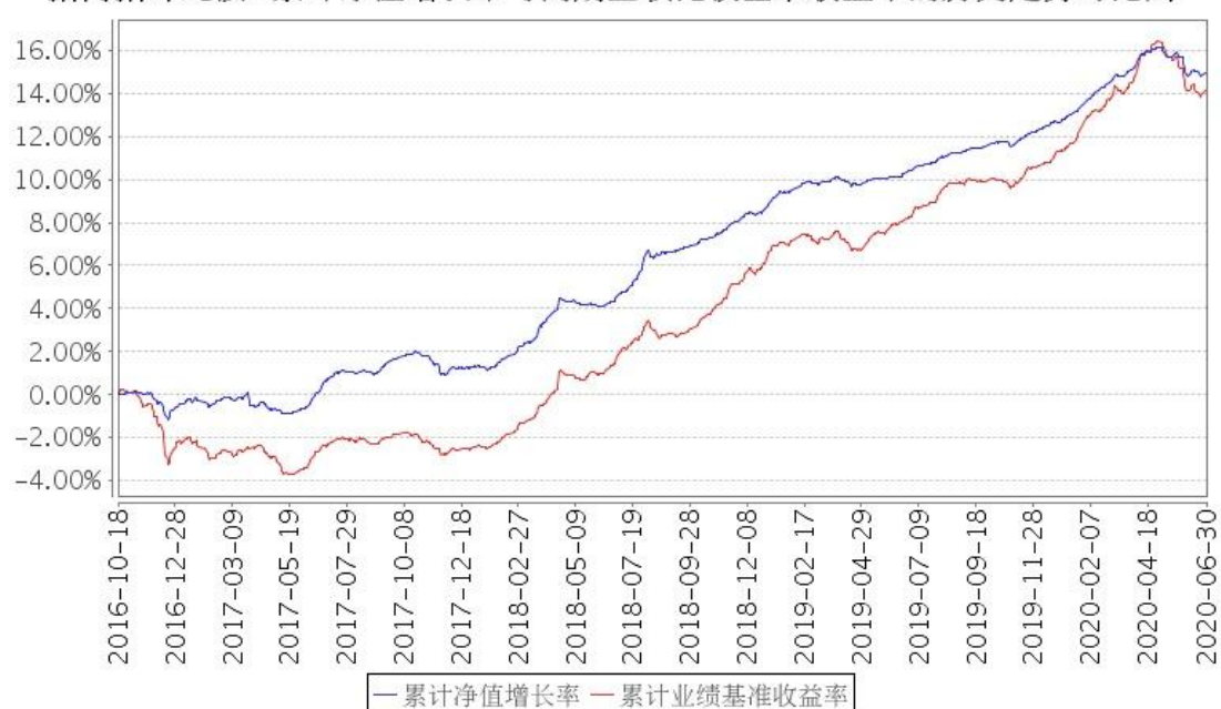
招商招坤纯债A累计净值增长率与同期业绩比较基准收益率的历史走势对比图