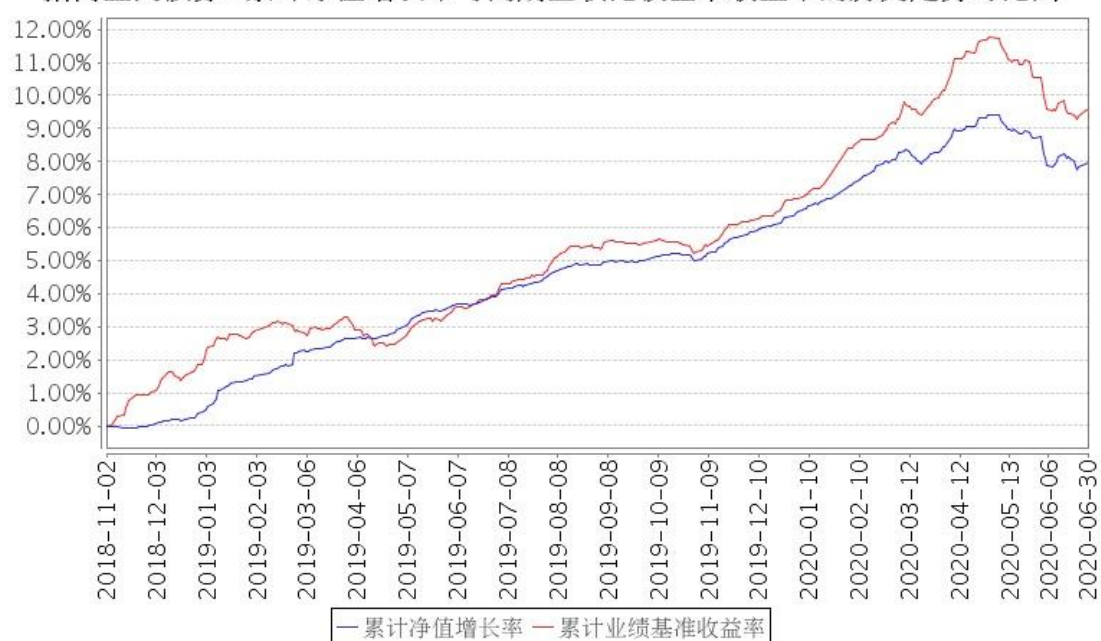
招商金鸿债券A累计净值增长率与同期业绩比较基准收益率的历史走势对比图