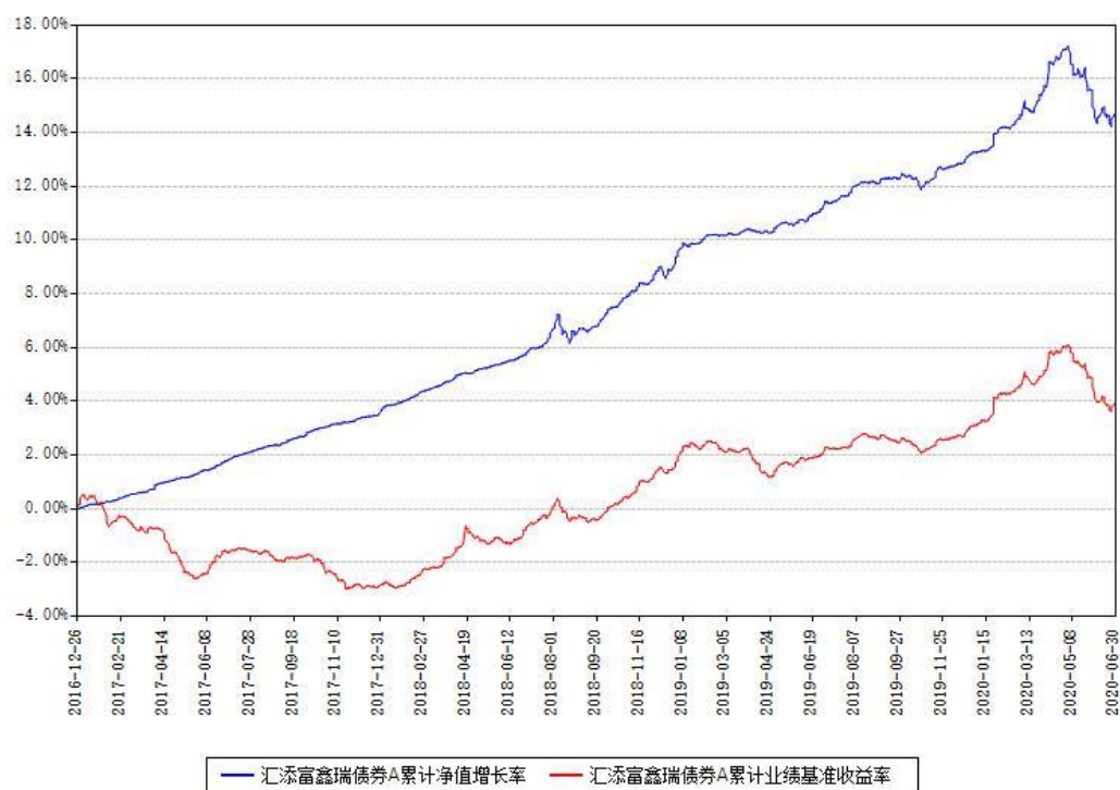
汇添富鑫瑞债券A累计净值增长率与同期业绩基准收益率对比图