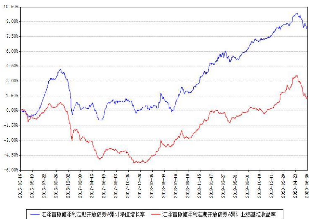
汇添富稳健添利定期开放债券A累计净值增长率与同期业绩基准收益率对比图