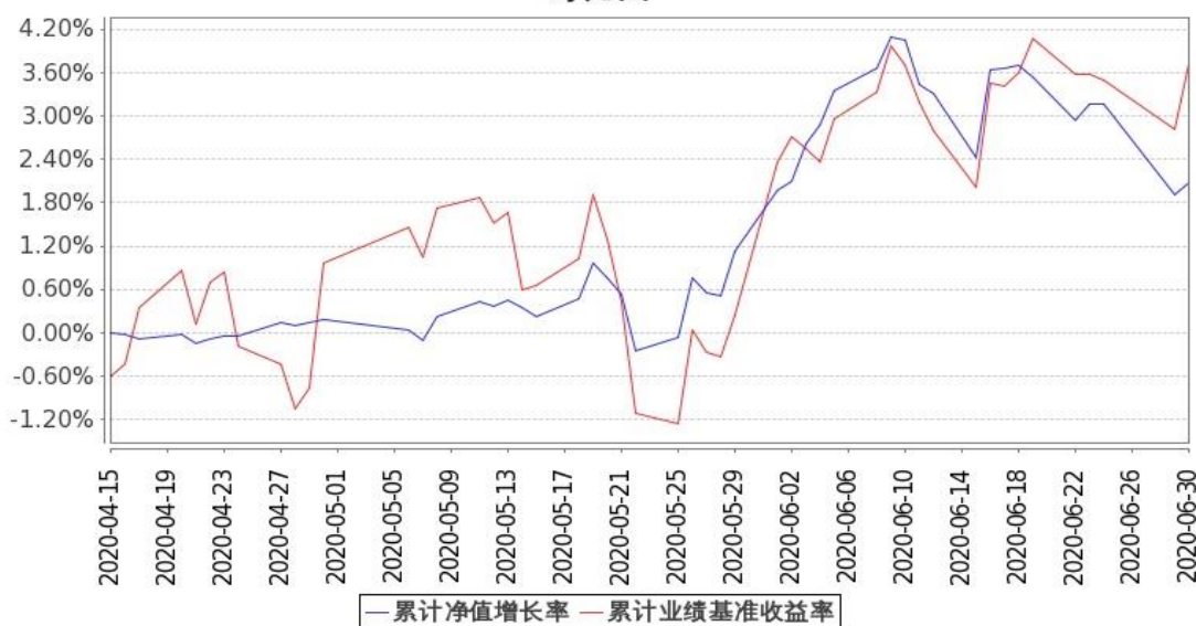
图 2：嘉实基础产业优选股票 C 基金份额累计净值增长率与同期业绩比较基准收益率的历史走势对比图