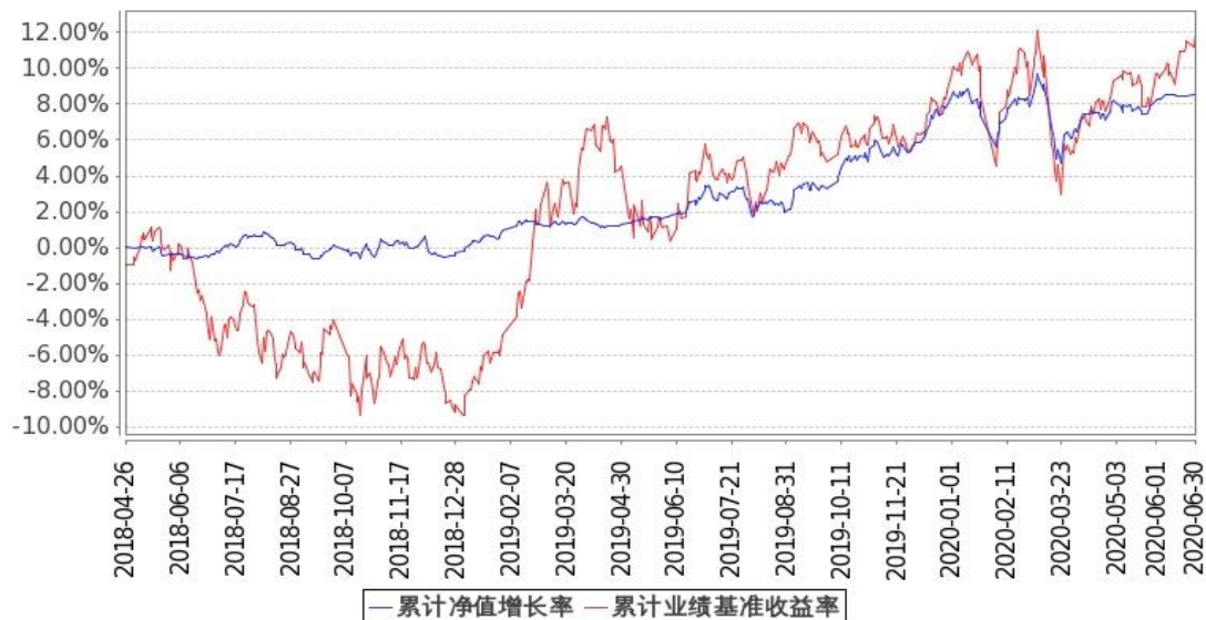
图 2: 嘉实新添荣定期混合 C 基金份额累计净值增长率与同期业绩比较基准收益率的历史走势对比图