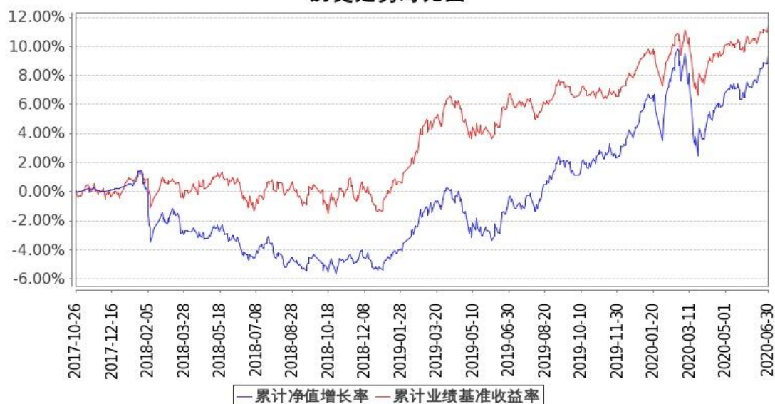
图 2：嘉实领航资产配置混合(FOF)C 基金份额累计净值增长率与同期业绩比较基准收益率的历史走势对比图