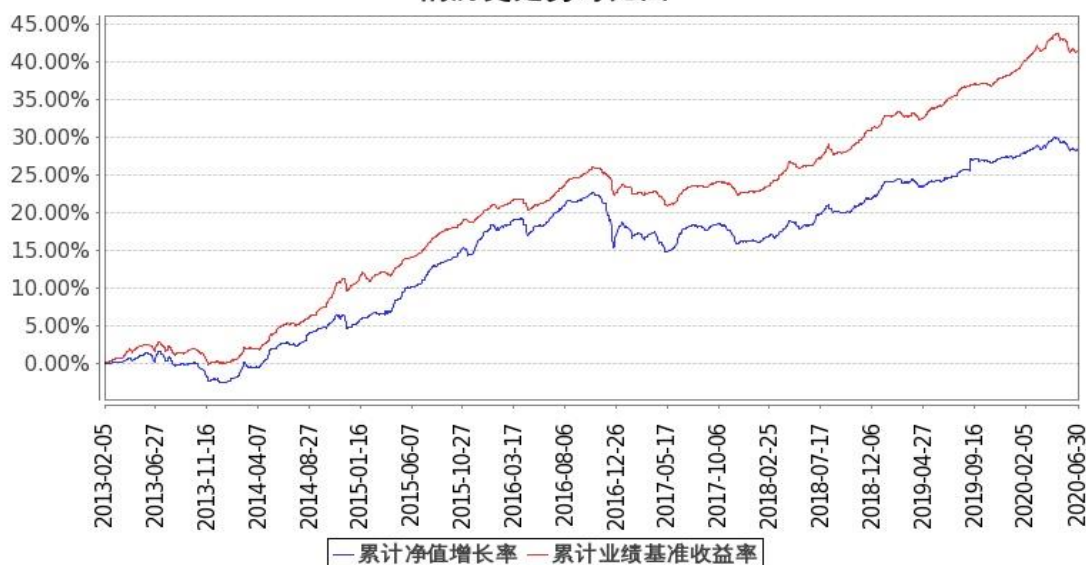
图 2: 嘉实中证中期企业债指数 (LOF) C 基金份额累计净值增长率与同期业绩比较基准收益率的历史走势对比图