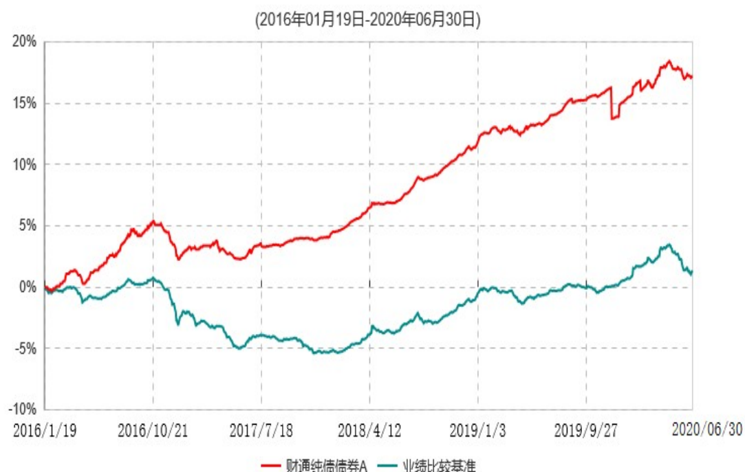
财通纯债债券A累计净值增长率与业绩比较基准收益率历史走势对比图