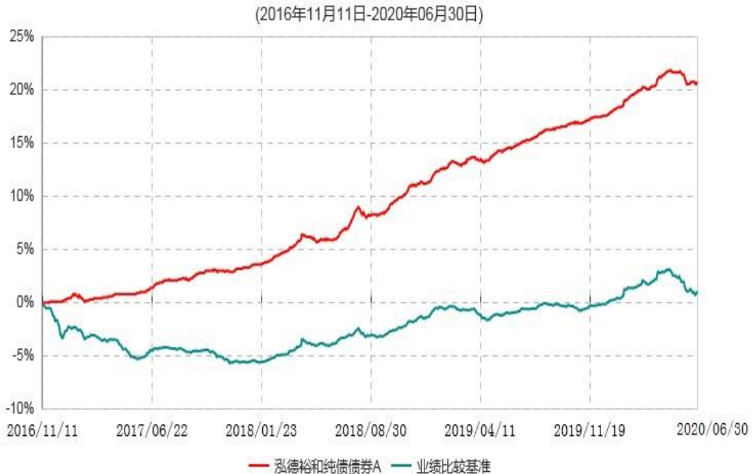
泓德裕和纯债债券A累计净值增长率与业绩比较基准收益率历史走势对比图